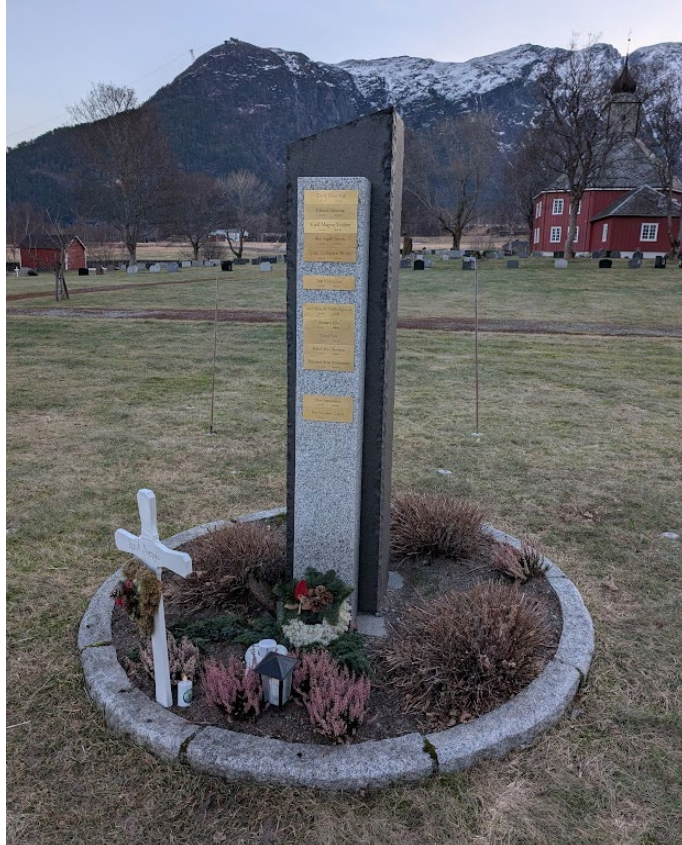
Navnet minnelund på Grytten kirkegård

DEN NORSKE KIRKE Rauma kirkelige fellesråd